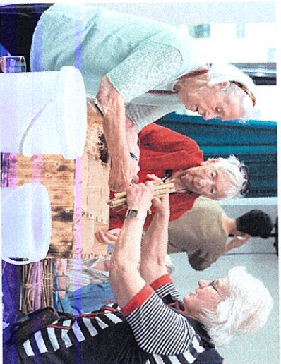
Ein Haus zum Wohlfühlen

Die Tagespflege des Mainzer Altenheims ist ein Angebot der teilstationären Pflege und Betreuung. Sie entlastet und hilft pflegenden Angehörigen und anderen Pflegepersonen, die häusliche Pflege sicherzustellen.