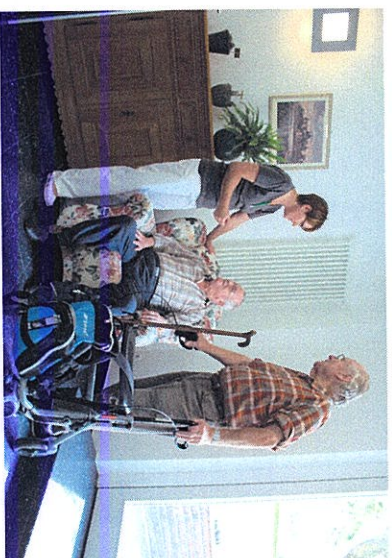
Was ist Tagespflege

Mit dieser kleinen Broschüre laden wir Sie ein, sich einen ersten Eindruck von uns, unseren Angeboten und unserem Haus zu machen.